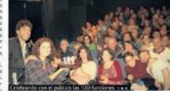
El público en el salón GLO 100 Asturias